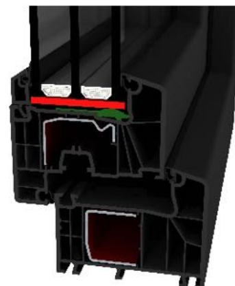
OPTION 3 SCHEIBEN